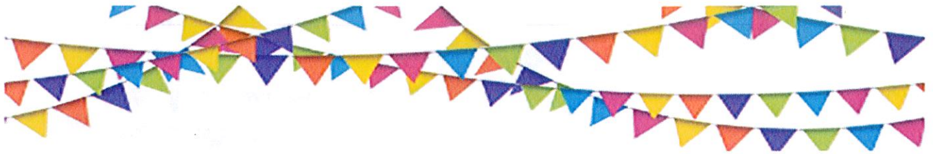
Groupe « POURKOIPA FAMILY »